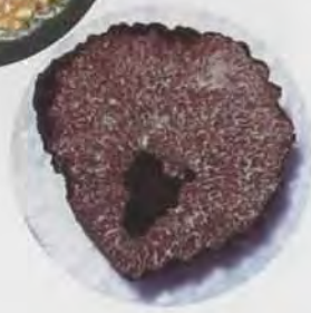
La Truffe méésentérique