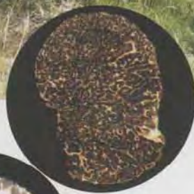
La Truffe noire