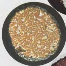
La Truffe de Bourgogne